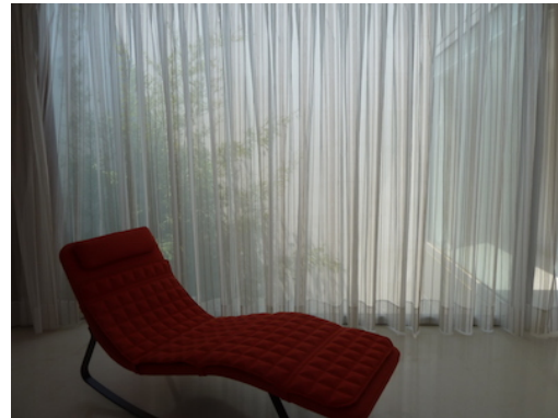
Limpieza de cortinas clásicas; todo tipo de tejidos