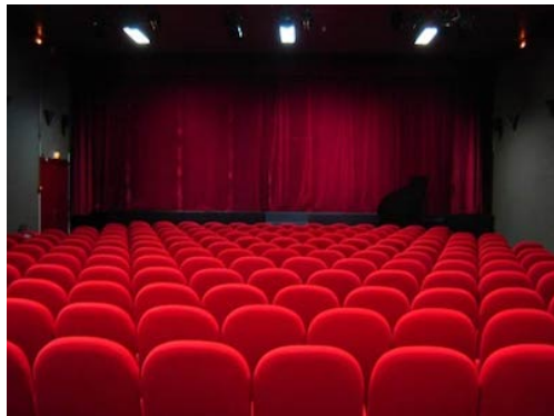
Limpieza de butacas en cines, teatros, auditorios, salas de actos...