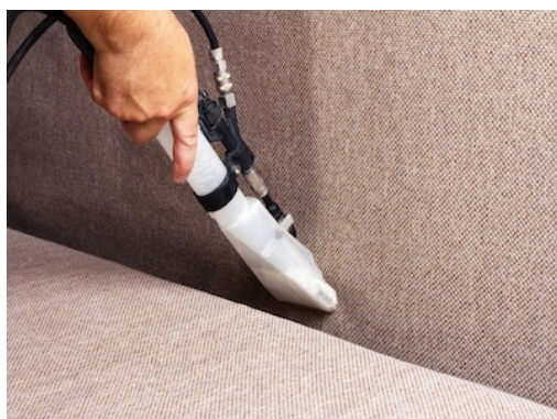
Limpieza sin desmontar de tapizados: sofás, butacas, etc.