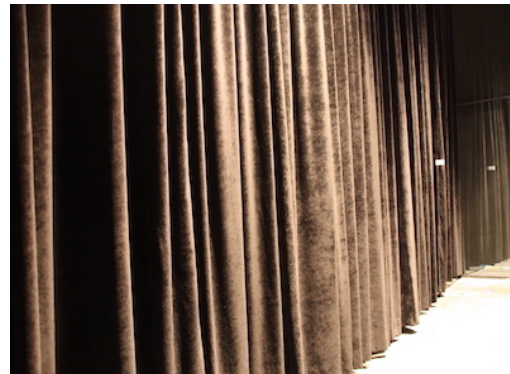
Limpieza de cortinas de grandes dimensiones en teatros, auditorios...