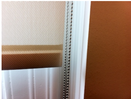
Limpieza de cortinas estores sin desmontar. Textiles, opacos, screen...