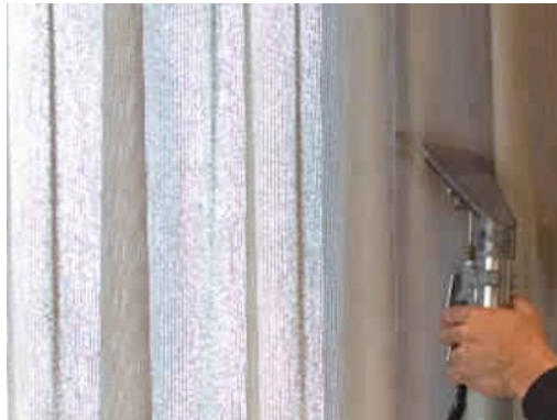
Limpieza sin desmontar