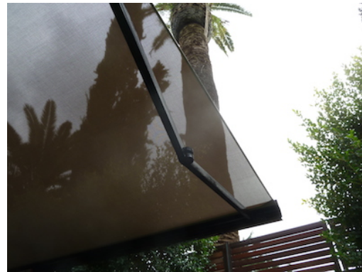
Limpieza de toldos